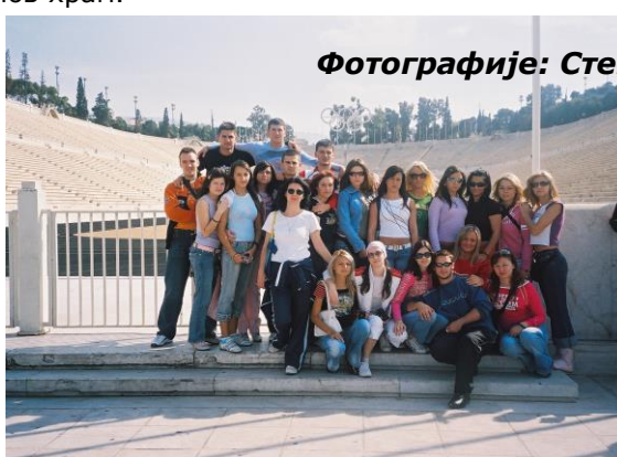
Ученици IVe3 крај олимпијског стадиона у Атени