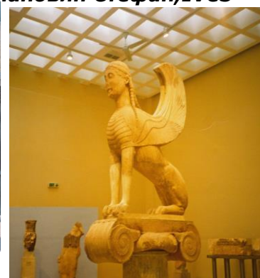
Музеј у Делфима