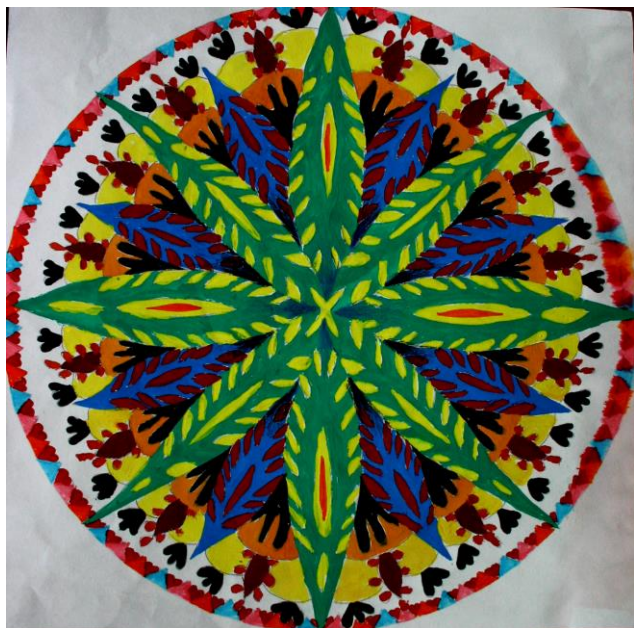
Томић Јелена, IIIy2