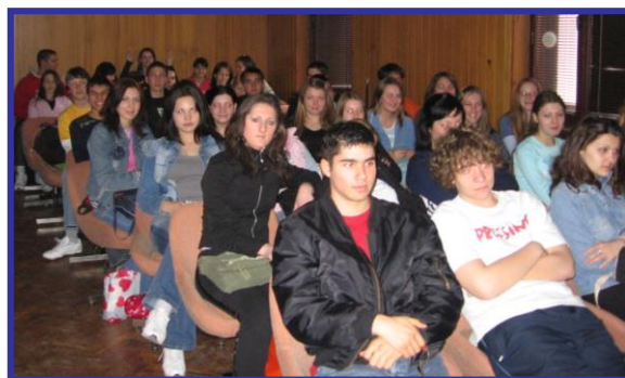
Ученици у медијатеци на часу трговинског

разреда трговинске струке. Они су имали прилике да виде како се излаже роба у светским трговинским центрима и да науче о трговини путем интернета. Овим часовима присуствовало је и неколико професорки економске струке, као и педагог школе. На крају су сви, а првенствено ученици, изразили искрено задовољство због успешно и ефектно изведеног часа.