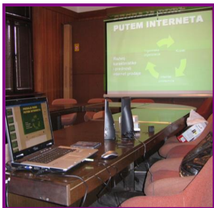
Нова опрема: лаптоп, пројектор, платно, звучници