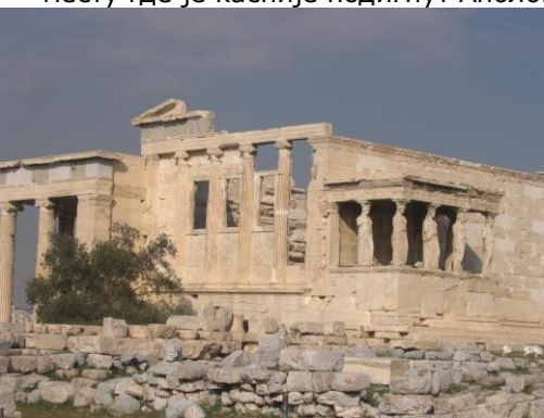
Акропољ – храм са стубовима у облику женских фигура

Сутрадан, у повратку, уследио је обилазак храма у Делфима, посвећеног богу светлости Аполону. Храм је познат и по пророчици Пителији. Према легенди, Бог Зевс је наредио да Делфи буду центар света, након што је пустио два орла са две супротне стране света и нашао средишњу тачку њиховог сусрета, баш на месту где је касније подигнут Аполонов храм.